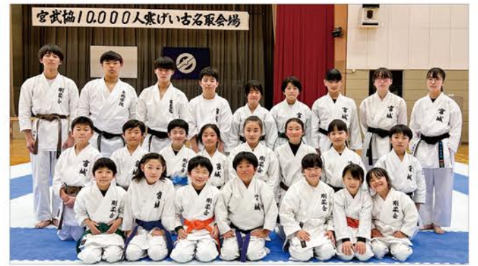
宮武協10,000人寒げい古名家会場